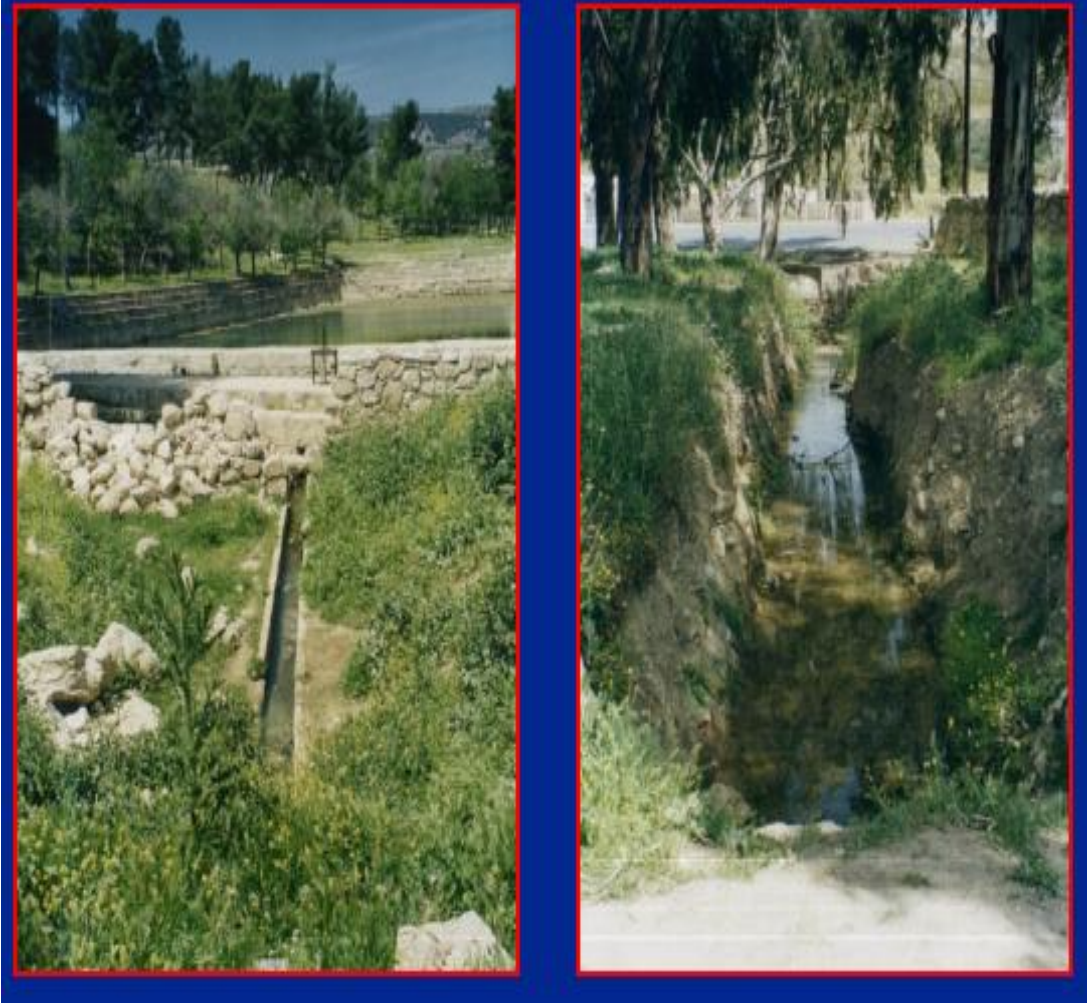
Plate (Photo) 1. A Photo of Qantara Spring Watershed